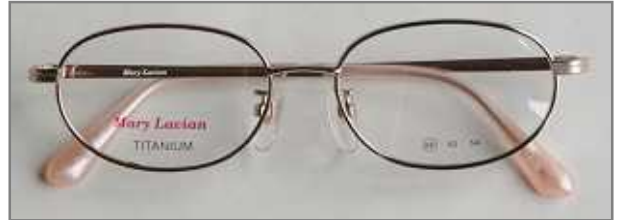
ML - 845 サイズ 50・52・54 / COL.G・PK