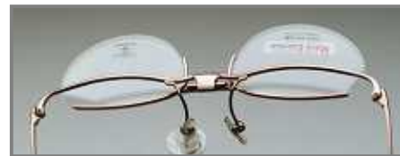
ML - 30